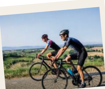
Vue panoramique depuis le Carla-Bayle

Y aller en fin d'après-midi, les meringues cuites au four à bois sont à tomber! Ensuite faire un arrêt au chemin de croix de Raynaude avec ses petites chapelles.