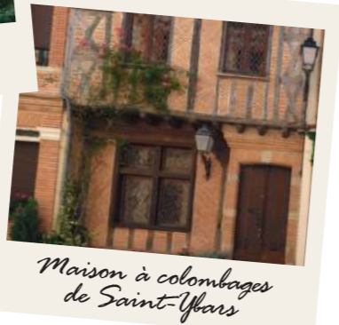
Maison à colombages de Saint-Ybars