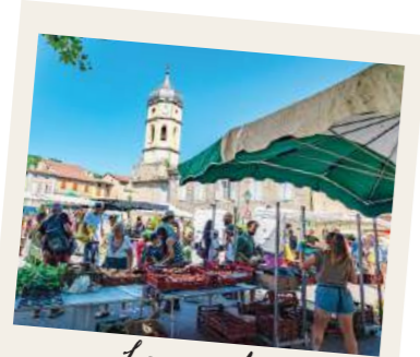
Le marché du Mas-d'Azil

Découvrez les bons plans testés et recommandés par les professionnels du tourisme du coin!